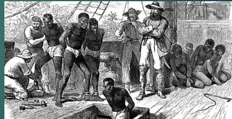
ΑΜΕΡΙΚΗ (ως το 1865)